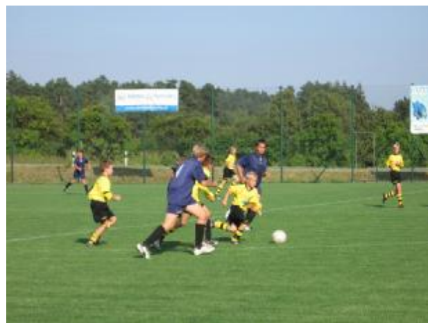
V zápalu boje

Uzávěrka článku FK Rudíkov -Trnava byla ke dni 2. 10. 2009.