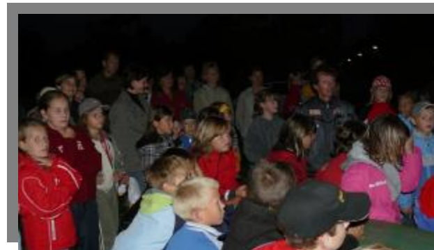
80 dětí v očekávání před začátkem stezky

Malí i velcí jistě rádi zavzpomínají na 1. rudíkovskou stezku odvahy, kterou připravilo na páteční zářijový večer téměř 30 mladých („i starších“) dobrovolníků a dobrovolnic. Cesta tmou lesem na Chroustov, kde děti plnily úkoly, byla téměř pro všechny zážitkem. Sladká odměna a klobás s limonádou, připravený Klubem 9 na konci cesty, byl po napětí a strachu příjemným a zaslouženým občerstvením.