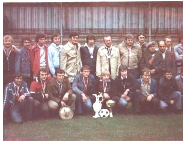
Zlatí hoši z roku 1979

Čerpáno z historického tisku a kroniky JZD „Mezilesí“.