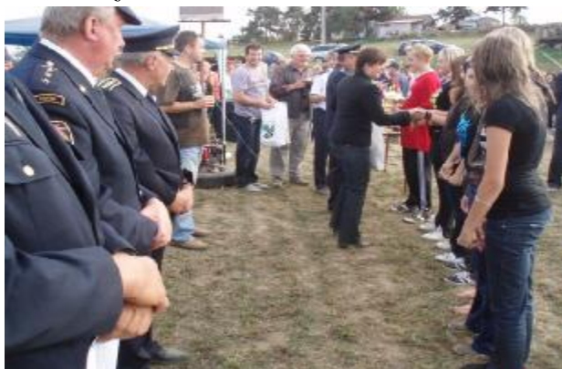
Předávání cen za účasti vedení ligy mládeže