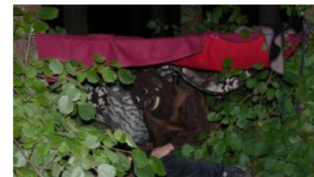
V lese se zabydleli medvědi