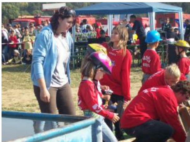
Příprava družstva mladší B s vedoucí