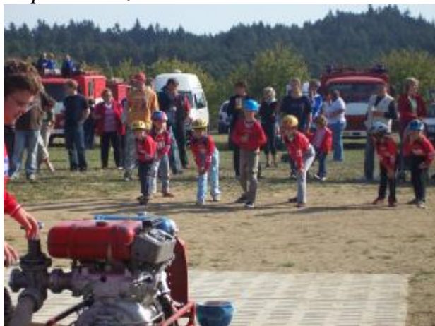
Start družstva mladší B