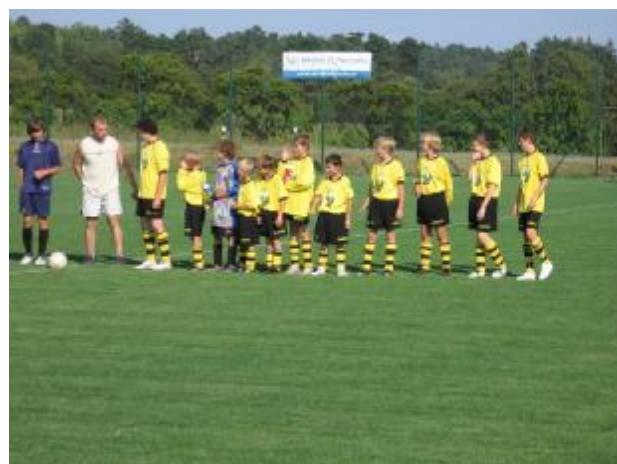
Nastoupené družstvo starších žáků

fotbalového umu v následujících zápasech. Doufejme, že se do rudíkovského prostředí opět vrátí vyšší soutěž. Tomu trnavskému by třetí třída také prospěla. Pro fotbal je důležitá i atmosféra, a proto apelujeme na diváky, aby přišli své týmy podpořit.